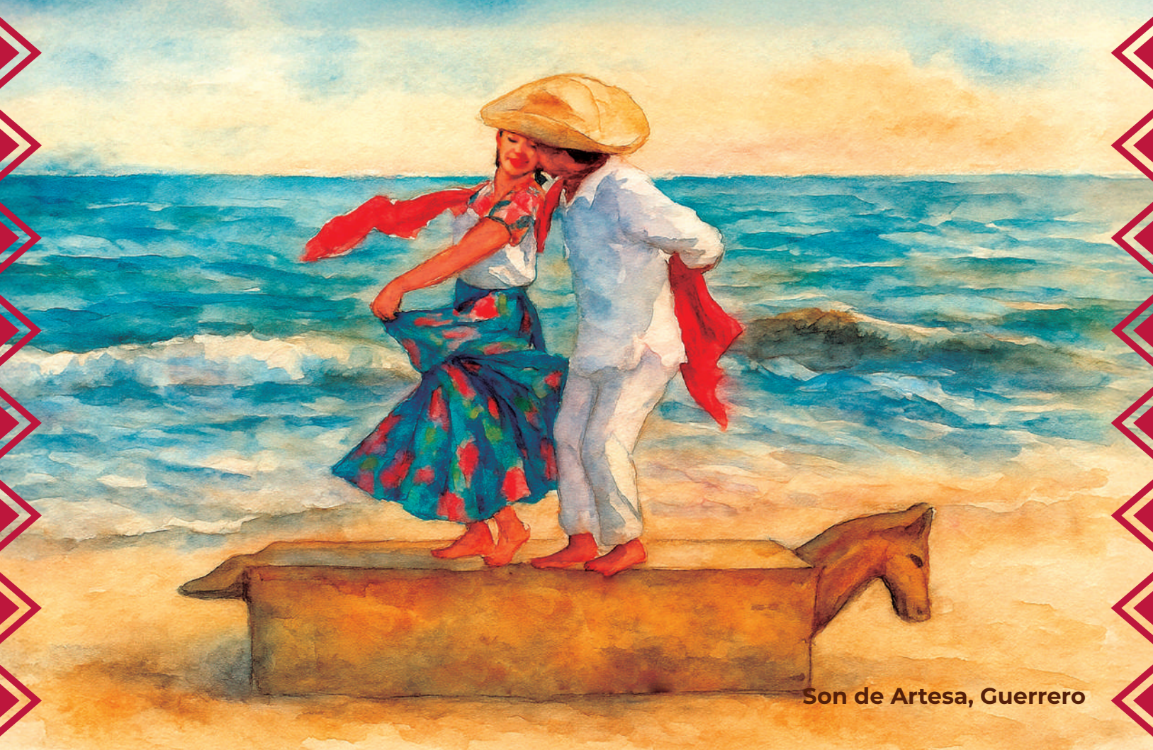
Son de Artesa, Guerrero