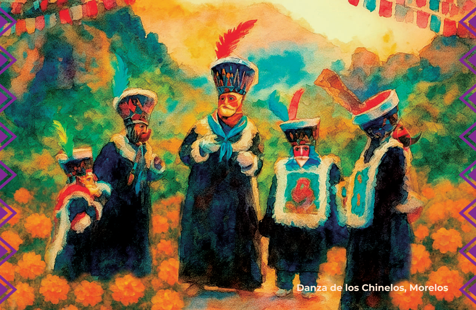
Danza de los Chinelos, Morelos