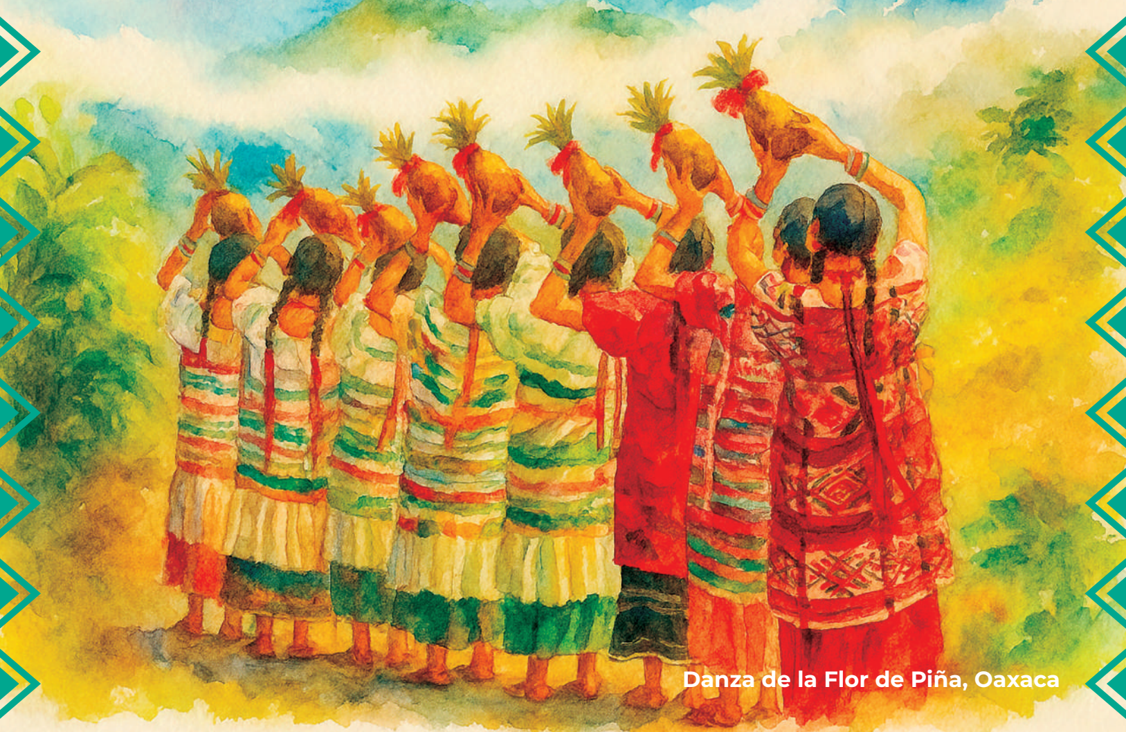
Danza de la Flor de Piña, Oaxaca