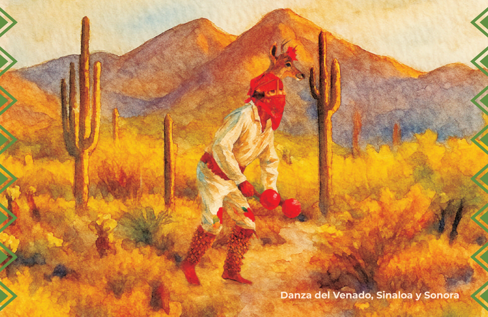
Danza del Venado, Sinaloa y Sonora