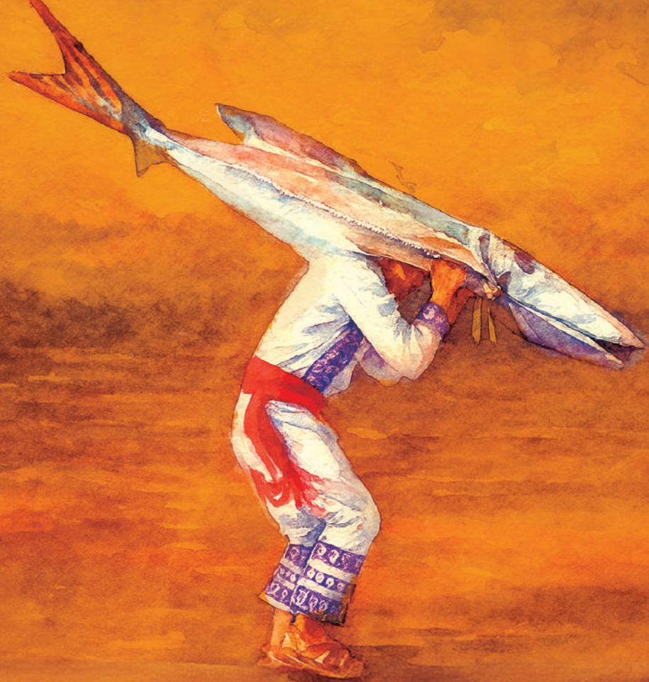
Danza del Pescado Blanco, Michoacán