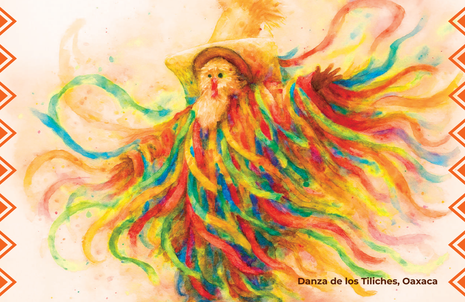
Danza de los Tiliches, Oaxaca