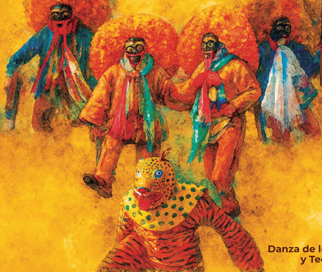
Danza de los Tlacololeros y Tecuan, Guerrero