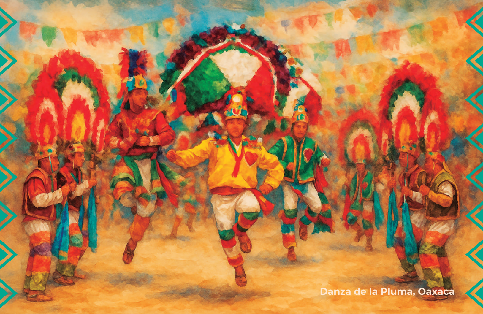
Danza de la Pluma, Oaxaca