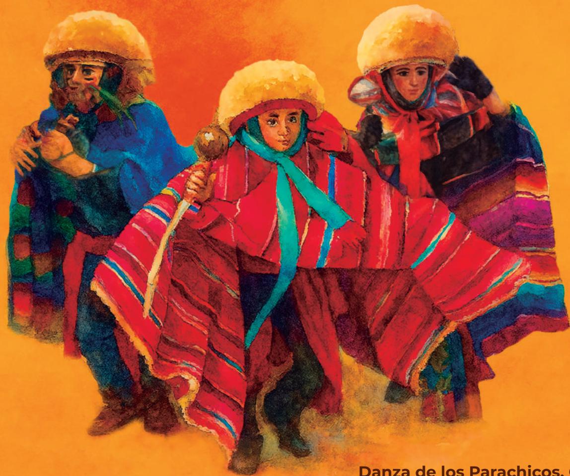
Danza de los Parachicos, Chiapas