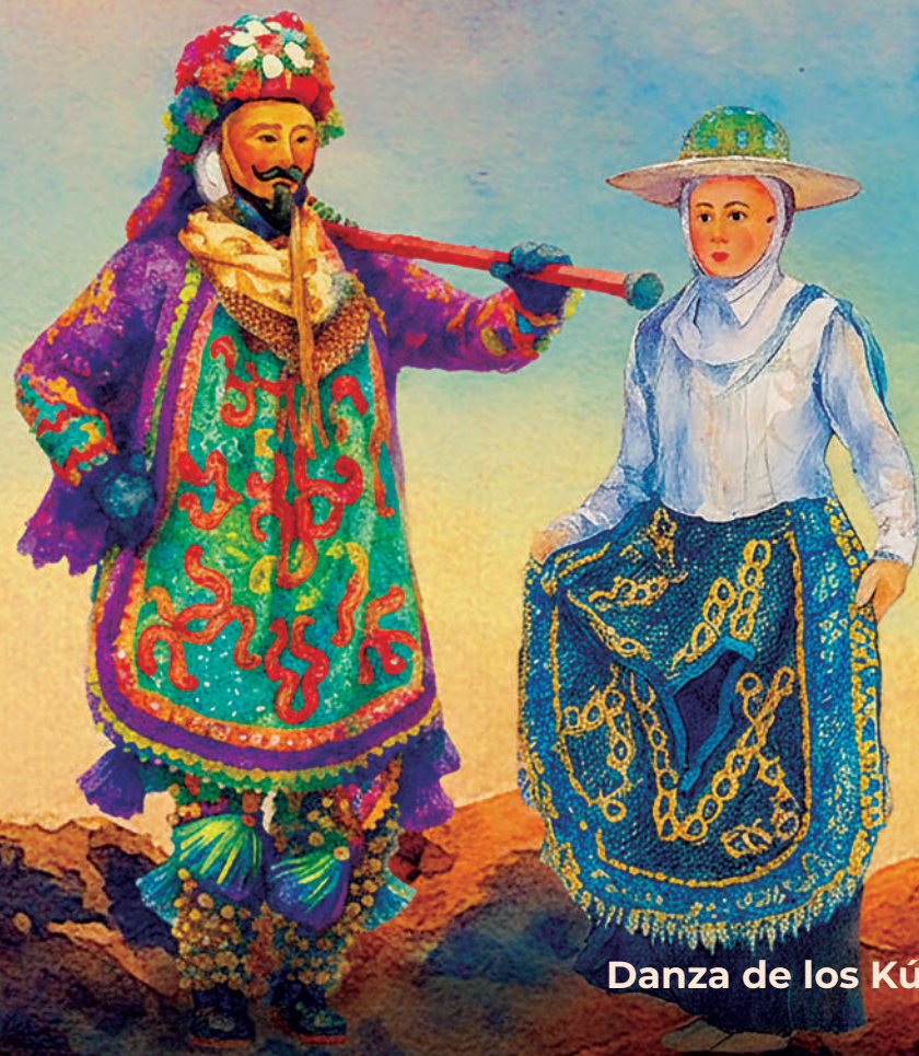
Danza de los Kúrpites, Michoacán