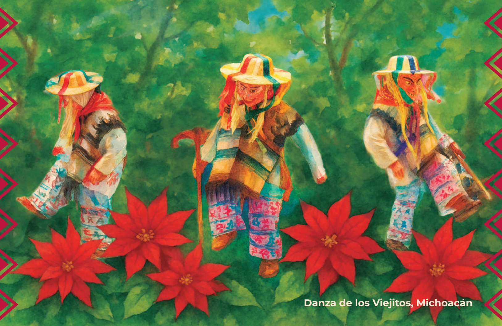
Danza de los Viejitos, Michoacán