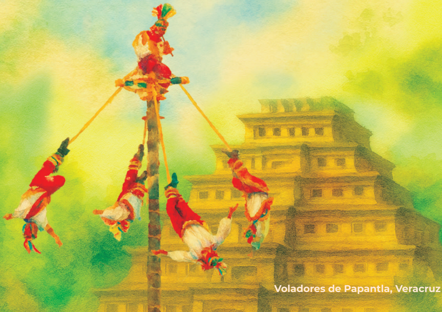
Voladores de Papantla, Veracruz