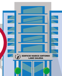
EDIFICIO MARCO ANTONIO LANZ GALERA

Periférico Sur 3469, colonia San Jerónimo Lidice, demarcación territorial La Magdalena Contreras, C.P. 10200, CDMX.