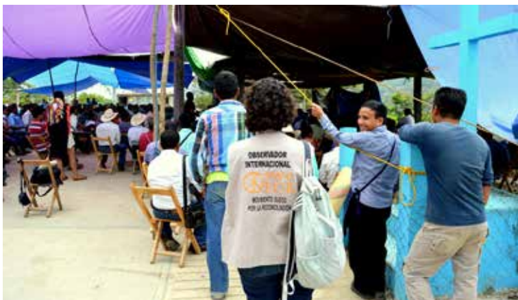
Labor de acompañamiento realizada por SweFor.